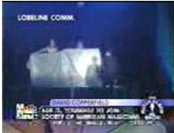
A lóca alatt sötétség honol

Amikor elmesélem ezt a történetet a barátaimnak, általában megkönnyebbülve és boldogan sóhajtok fel. Tessék a megfejtés. Pontosabban a még nagyobb csodálkozás amiatt, hogy milyen trükkökhöz folyamodik a nagy mágus.