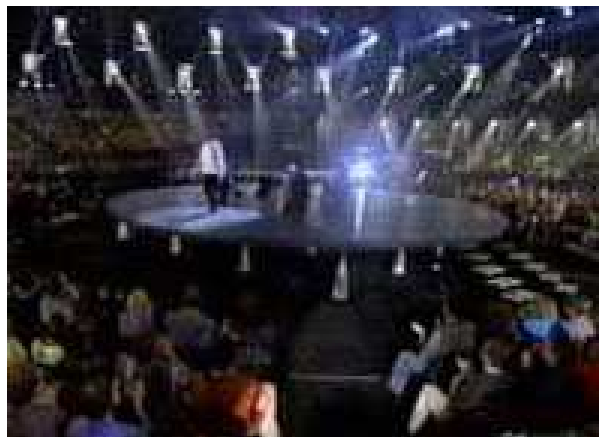
A nézők a színpad körül ülnek

Úgy látszik, hogy Copperfieldről korábban mondott szavaimat vissza kell vonnom, hiszen azokat a Tűztornádóhoz képest egyszerűen angyalian egyszerűnek, ártatlannak lehet nevezni! Éppen itt van a kutya elásva. Hiszen a felvételek alatt a körszínpad két szélén és a hátsó részén ülő nézők nem igazi nézők! Igen... Lassan már elszoktam az "álnézők" kifejezéstől, de hát mit tegyünk. Ne siessenek a "Miféle álnézők? Annyian vannak, hogy nincs annyi asszisztense Copperfieldnek" -- felkiáltásokkal!