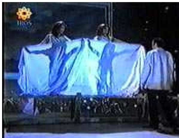
A lóca alatt láthatjuk a nézőket

Eszembe jutott, hogy az egyik web-oldalon láttam egy rövid videófelvételt, amelyen a mágus valamilyen interjút adott. Ebben az adásban részleteket mutattak a trükkökből, miközben ő azokat kommentálta. Ezek a részletek a mutatványokkal ebben az interjúban valóságosak voltak, vagyis nem a Tűztornádó tévés változatából valók, hanem Copperfield valódi fellépéseiből. Most pedig nézzék meg. Az első kép a reklámverzió "eltűnése", vagyis a képkockák a Tv-special Tornado of Fire showból. A lóca alatt láthatjuk a nézőket.