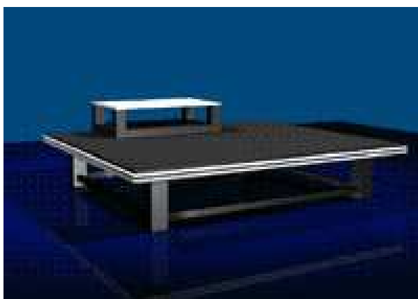
Az asztal modellje

Az alábbi képen látható az asztal háromdimenziós modellje. Láthatjuk magát az asztalt és rajta a kisebb asztalkát.