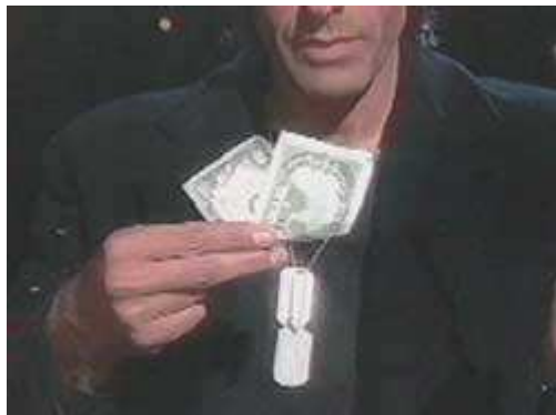
A tartozék ott marad a félbehajtott bankjegyen

Végül az utolsó mozzanat. David azt a látszatot kelti, hogy a ceruzát ismét a félbehajtott százasba csúsztatja, miközben valójában az a bankjegy mögé kerül. A bűvész a tartozékot eközben ráhúzza a ceruzára.