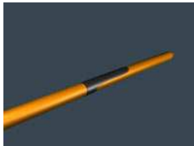
A vékony lapocska a ceruzát egyik oldalról eltakarja

Szerkezetileg két részre osztható: a gyűrűs rész, amibe a ceruza kerül, és a vékony lapocska, ami a ceruzát egyik oldalról eltakarja (hasonlít a tollak rögzítő fülére).