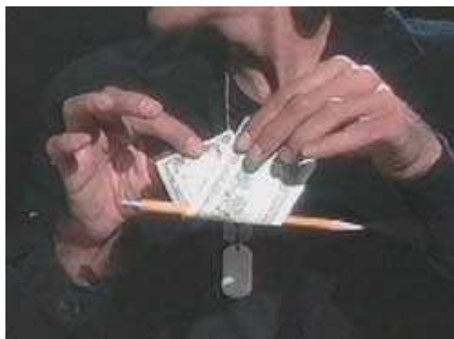
A ceruza a bankjegy mögött van

Mivel a tartozék eleje a kettéhajtott bankjegyen belül volt, úgy tűnik, hogy az egész ceruza a félbehajtott százason belül van. Miután rögzítette a ceruzát a tartozék gyűrűjébe, nyugodtan elengedheti.