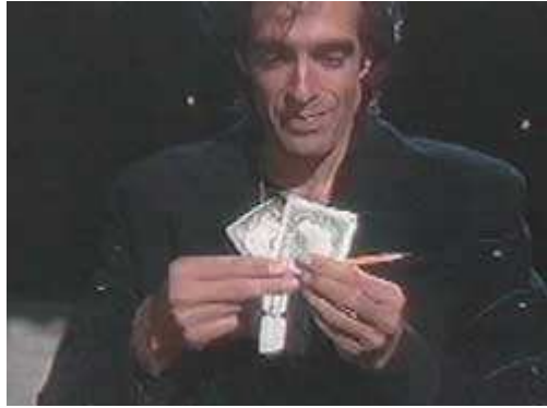
Kihúzza a ceruzát