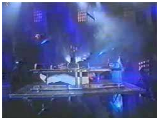
A feje egyre jobban közeledik a lábaihoz

Az illúzionista belefekszik a ládába. Ebben a pillanatban kidugja a műlábfejet, a sajátját pedig a láda alá rejti (az asztal titkos üregébe).