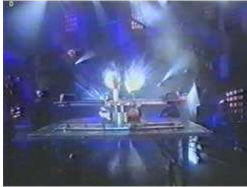
A feje a lábfejéből nőtt ki

Most már csak az a feladata, hogy magához húzza a múlábfejet, és a megfelelő hatást máris elérte. Az eredeti testhelyzete nem változott. A múlábat egy egyszerű szerkezet mozgatja. Hasonló tárgyakat használ más mutatványoknál is.